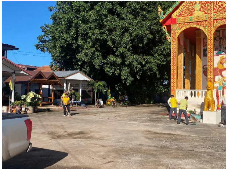
กิจกรรม Big Cleaning Day ทำความสะอาด แหล่งท่องเที่ยว แก่งโดน